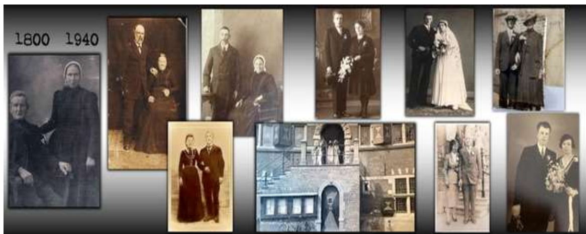
Foto's bruidsparen van 1800 tot heden

Deze activiteit had een speciale aanleiding, het Stadhuis van Klundert bestond 400 jaar! Cultuur Moerdijk en de Heemkundekring zochten hiervoor samenwerking. Heemkundekring 'Die Overdraghe' nam het initiatief tot een bijzondere viering van dat jubileum en riep bruidsparen op hun Stadhuis-trouwfoto in te sturen. Vele bruidsparen die getrouwd waren in het Stadhuis kwamen een kijkje nemen en lieten zich weer als paar fotograferen. Zo ontstond een prachtig tijdbeeld.