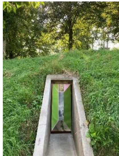
Fotokunst voor de bunkers